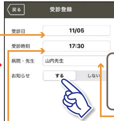
③【受診日】、【受診時刻】、【病院・先生】(※自由登録)