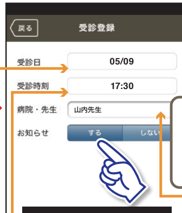
③【受診日】、【受診時刻】、【病院・先生】(※自由登録)