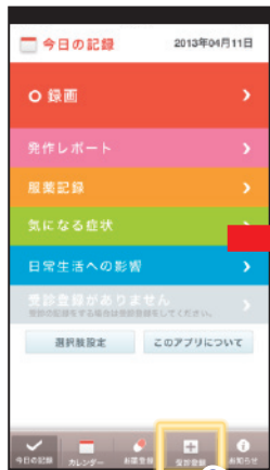
①【受診登録】をタップ