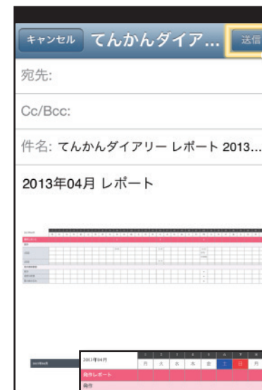
③メールが立ち上がって、記録したデータが画像ファイル(.png)として添付されます【送信】ボタンで送信