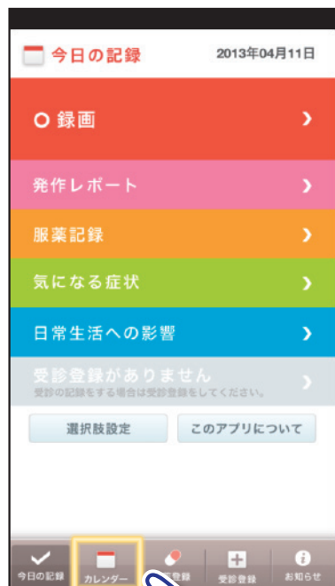
①【カレンダー】をタップ