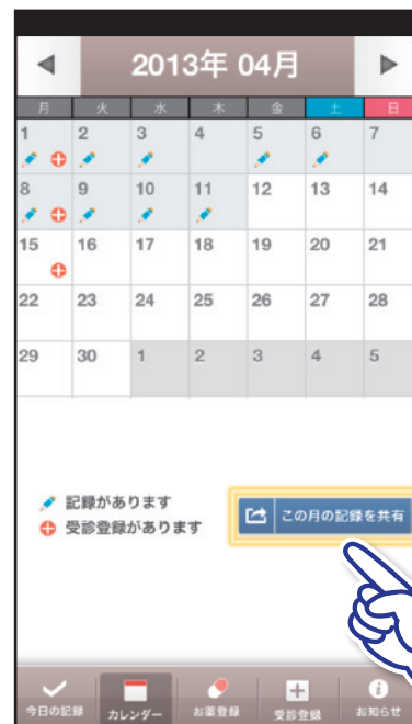
②【この月の記録を共有】をタップ